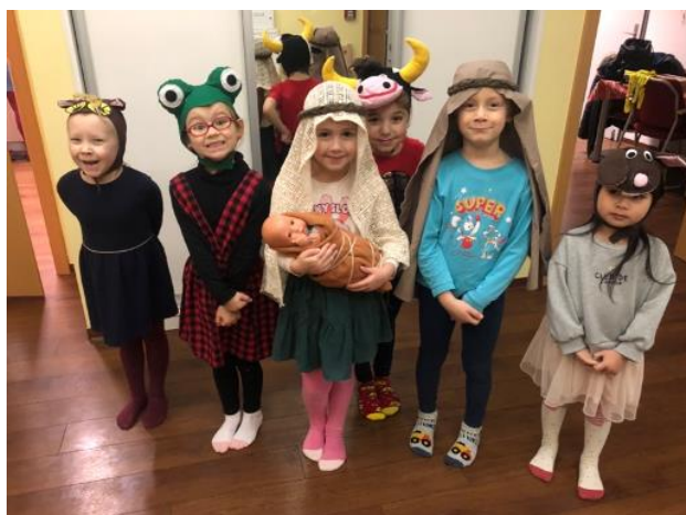
Fotky: předškoláci divadelní představení