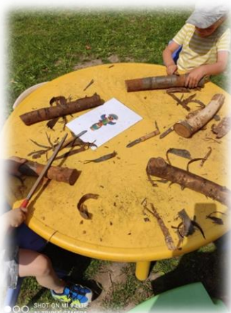
Fotky: výroba totemu