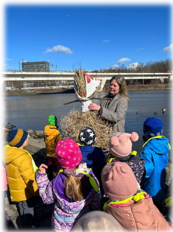
Fotky: vynášení Morany