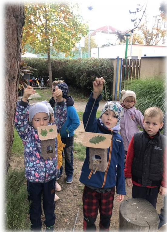
zavěšování vyrobených budek